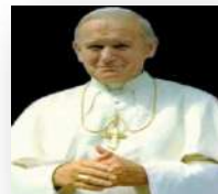
San Juan Pablo II

ACTIVIDAD 6: La siguiente actividad está enfocada a dejarse asombrar por la maravilla de la vida y reconocer cuándo empieza la vida humana. Para ello se les proyecta un video titulado “ La Odisea de la vida ” ( https://www.youtube.com/watch?v=yvr5UCDM9QI ). Puede ser invitado el profesor o profesora de Biología para que explique las imágenes proyectadas. Si no es posible, se aporta una breve explicación: